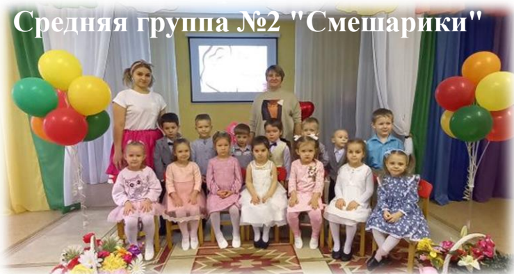
Средняя группа №2 "Смешарики"

С Днем матери от души поздравляем всех мам, и желаем им оставаться такими же чуткими и понимающими, добрыми и сильными, мудрыми и тактичными. Пусть никогда не будет слез в материнских глазах, пусть лица светятся от улыбок, пусть мамы ощущают тепло и любовь от своих взрослых и маленьких детей! Будьте здоровы, успешны, красивы и по-настоящему счастливы!