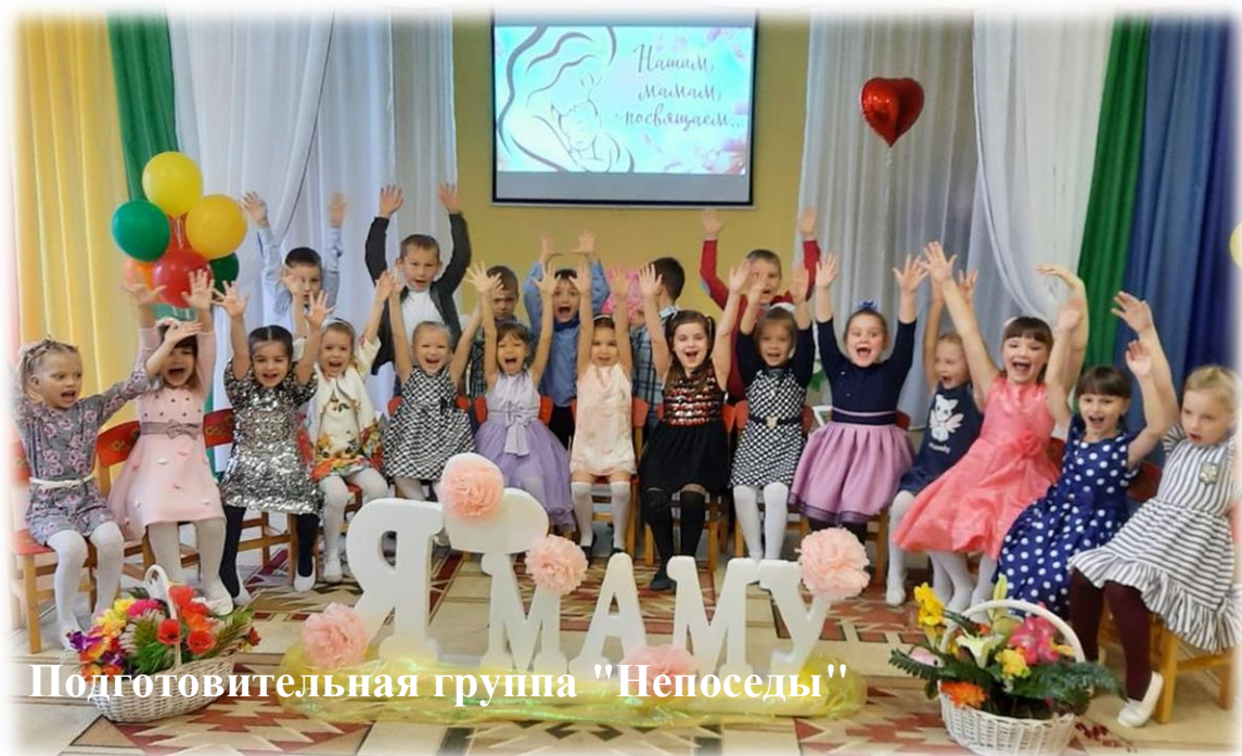
Подготовительная группа "Непоседы"