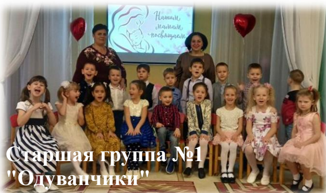
Старшая группа №1 "Одуванчики"