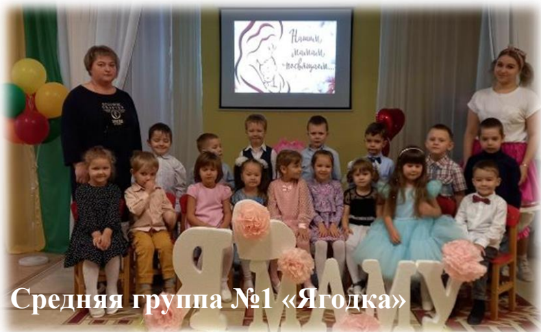
Средняя группа №1 «Ягодка»

С кем первым мы встречаемся, Придя на белый свет, — Так это наша мамочка, Ее милее нет. Вся жизнь вокруг нее вращается, Весь мир наш ею обогрет, Весь век она старается Нас уберечь от бед. Она — опора в доме, Хлопочет каждый час. И никого нет кроме, Кто так любил бы нас. Так счастья ей побольше, И жизни лет подольше, И радость ей в удел, И меньше грустных дел!