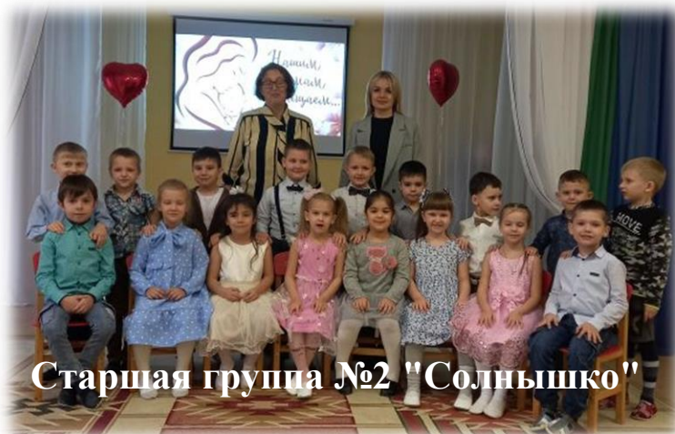
Старшая группа №2 "Солнышко"